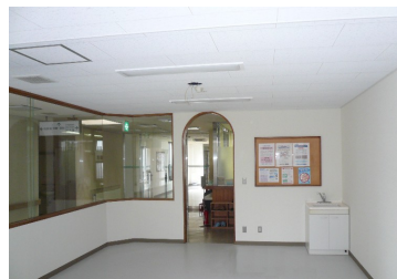
リニューアルした待合室