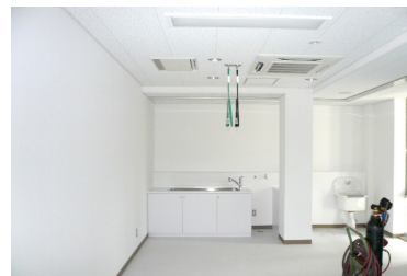
内視鏡室やトイレも合わせて新設しました