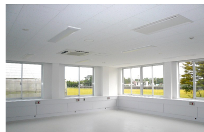
窓の外には鹿妻駅が見えます

真壁病院も石巻管内の血液透析治療の一端を担うことで地域の皆様により良い医療を提供していきたいと考えております。スタッフ一同透析技術の更なる向上を目指し研鑽を重ね、患者様のニーズに合わせて努力していきたいと思っております。ご不明な点などありましたら、いつでもお尋ね下さい。