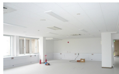
9月中旬の透析室のようす

わが国で透析治療を必要としている患者様は26万人と人口500人に1人の割合となっております。治療技術も進み、透析患者様の生存率も伸びてきております。30年前は透析治療開始してからの5年生存率は50%と言われていましたが、最近では100%近い数値となっておりますし、更に15年生存率も78%となっております。生存率が伸びていくのに伴い、透析患者様も増加傾向にあります。