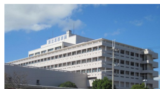
沖縄県立北部病院 (名護市)

そこで救急や内科全般の知識を習得すべく平成23年より3年間沖縄県立北部病院で修行しました。若い医師と共に病院にはりつき、優秀な指導医と1人1人の患者様について連日議論する形でたくさんの経験を積ませていただきました。