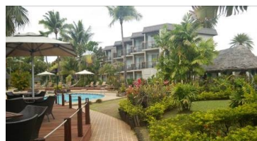
検診会場として利用させて頂いたホテル