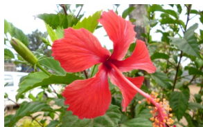
宿に咲いていたハイビスカス

こういった現状を目の当たりにすると、日本はとて恵まれた環境だと思いました。日本には良い環境がせつかくそろっていますので、普段から健康診断等で病院を有効活用し、少しでも苦痛のない生活をお送りいただければと思います。