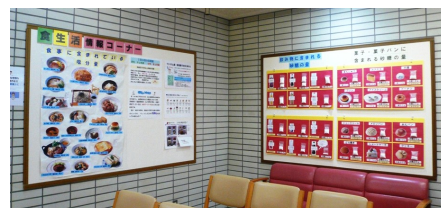
待合室の食生活情報コーナー

また甘い物を食べる時に、甘いジュースなど飲むのは控えましょう。食生活情報コーナーでは今後も食生活に関わる情報を発信していきますので、診察の待ち時間にぜひご覧下さい。