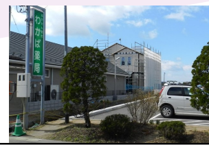
あっという間に外観が出来てきました

ご来院の際は、お気を付けてご通行下さいますようお願い致します。営業開始は5月末～6月頃の予定です。工事期間中は、ご迷惑をお掛けしますが、どうぞよろしくお願い致します。