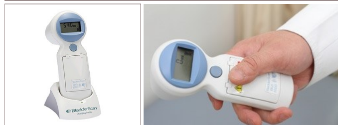
残尿測定装置 お腹にあてるだけの超音波検査です

となります。(初診・再診料を除く、検査のみの金額) 詳しくはスタッフまでお尋ね下さい。