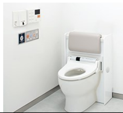
尿流量測定装置 普通のトイレのように使用するだけで 現在の中待合室の奥の 採尿室を改装し、設置の予定です