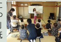
宮戸クリニック開院10周年記念式