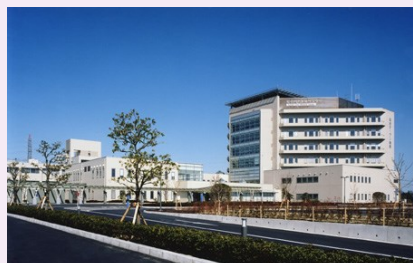
仙台オープン病院

平成24年4月には人間ドック・健診施設機能評価 Ver.2.0に認定されており、安全で質の高い健診施設として好評です。