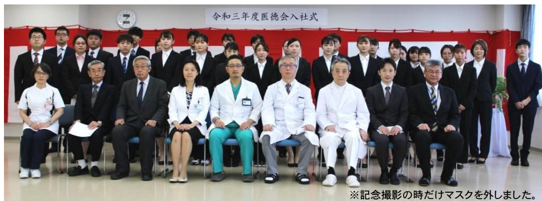
※記念撮影の時だけマスクを外しました。

当法人では、今年度28名の新入社員を迎えることができました。新たな仲間と共に力を合わせ、地域医療に貢献すべく邁進してまいります。どうぞよろしくお願い致します。