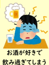
お酒が好きで 飲み過ぎてしまう