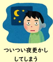
ついつい夜更かし してしまう