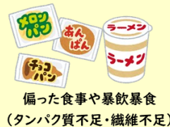
偏った食事や暴飲暴食 (タンパク質不足・繊維不足)