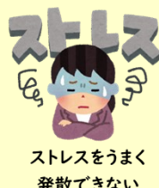
ストレスをうまく 発散できない