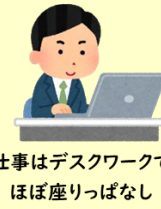
仕事はデスクワークで ほぼ座りっぱなし