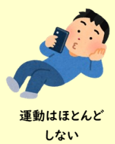
運動はほとんど しない