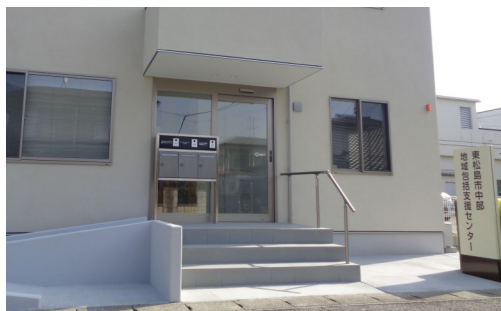
3/25撮影。引っ越し直前です。